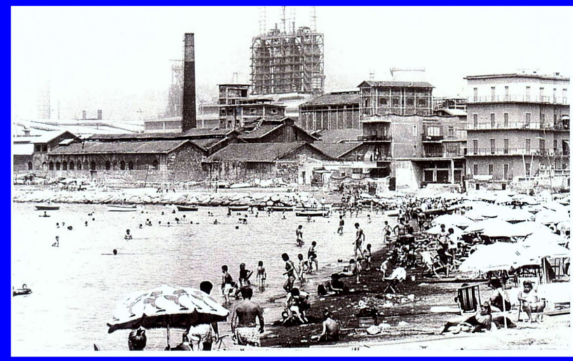
Coroglio, Lido Limpido - anno 1934

“... affianco ci sta questo bagno Limpido, forse perché c'era l'acqua limpida” (Masina Cella)