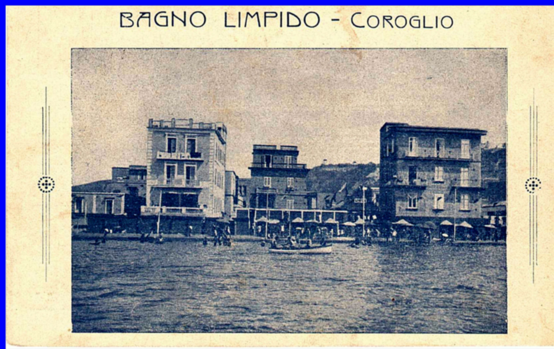
Coroglio, Lido Limpido - anno 1927