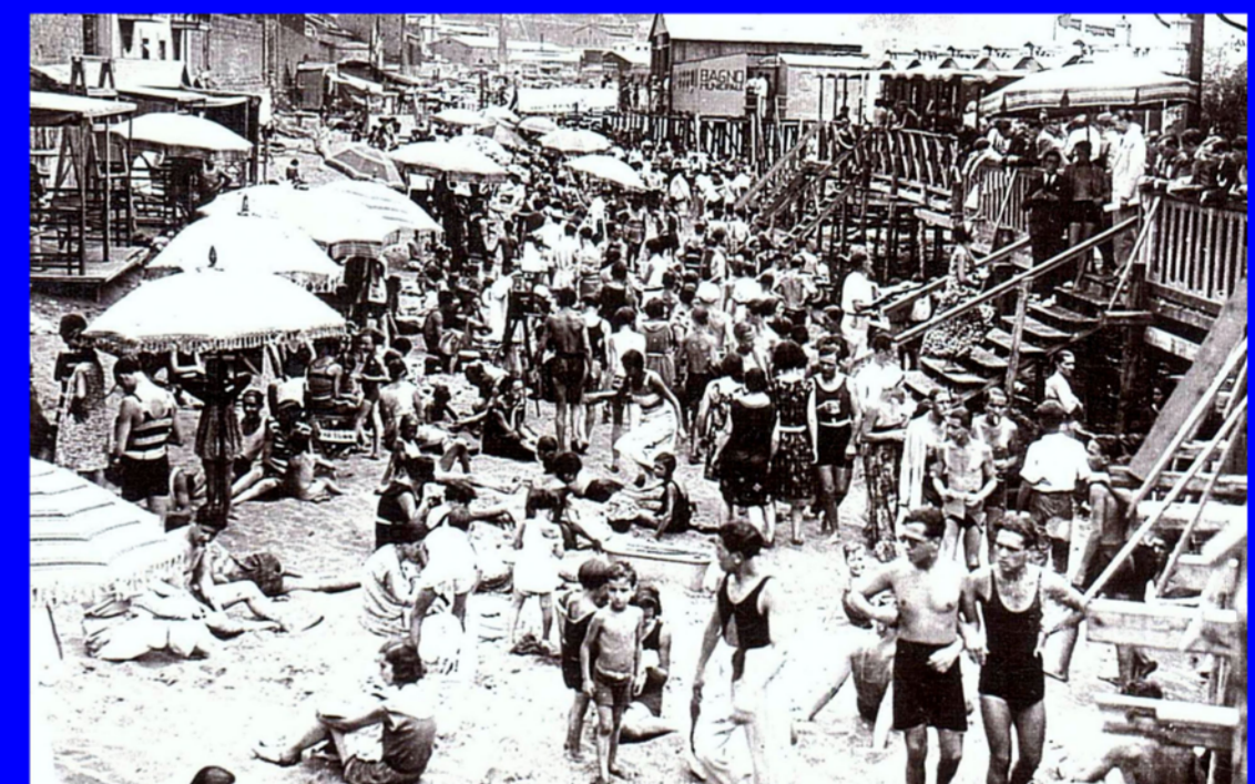
Coroglio, Bagno Municipale - anni '50