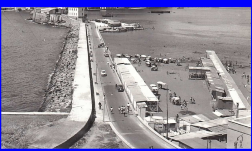
Coroglio, Lido Pola - anni '50