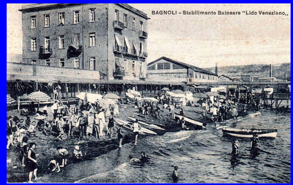
Coroglio, Lido Veneziano - anno 1932