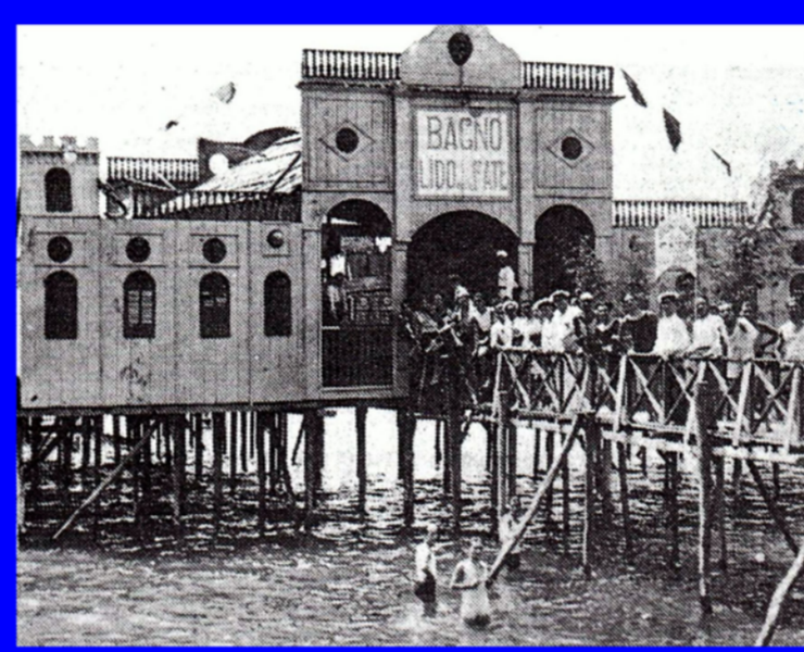
Coroglio, Lido delle Fate - anni '20