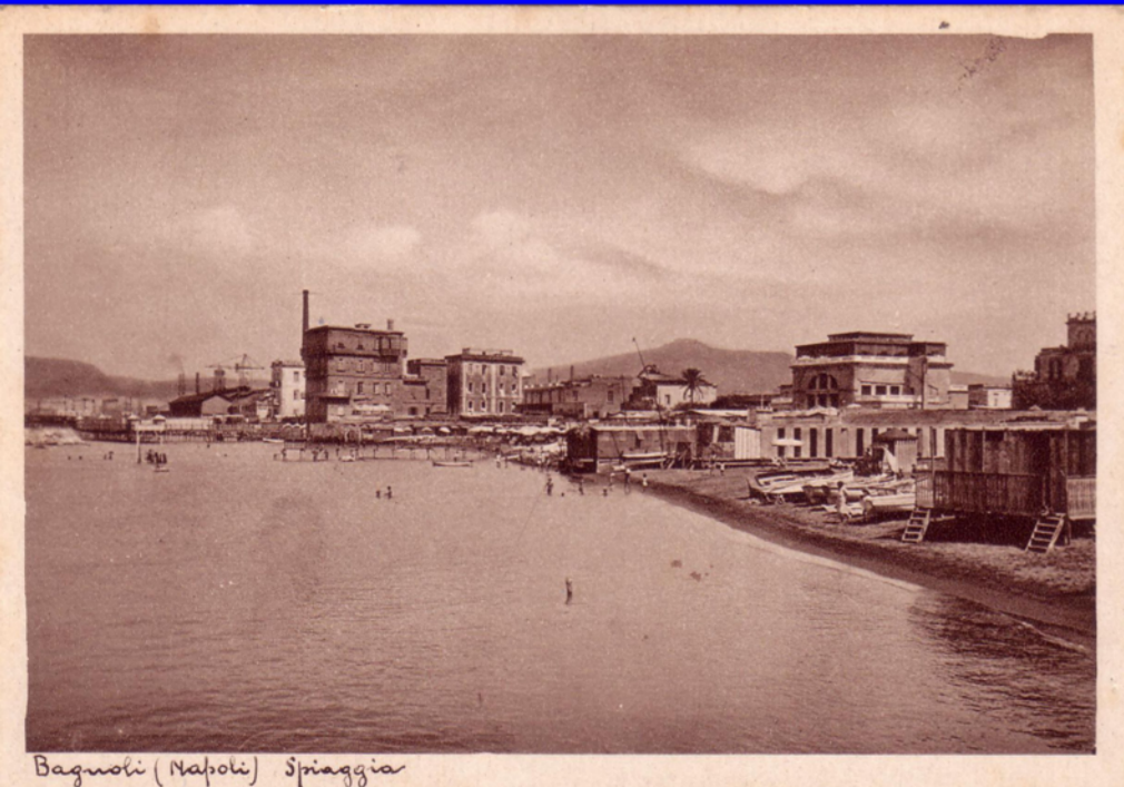
Bagnoli, Lidi vari