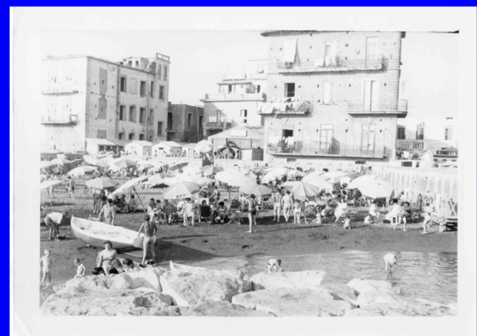
Coroglio, Lido Limpido - anni '60 (raccolta fotografica Lino D'Antonio)