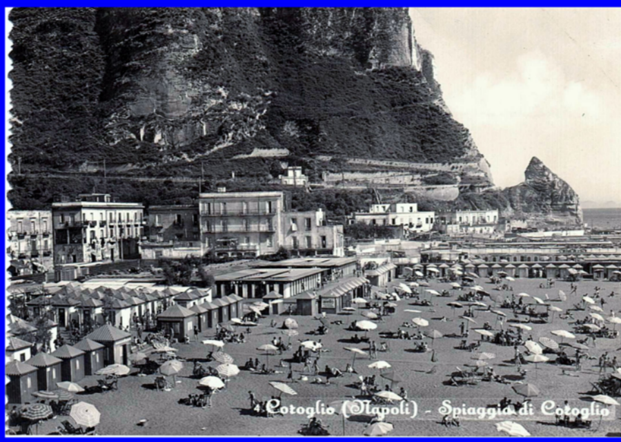
Coroglio (Napoli) - Spiaggia di Coroglio