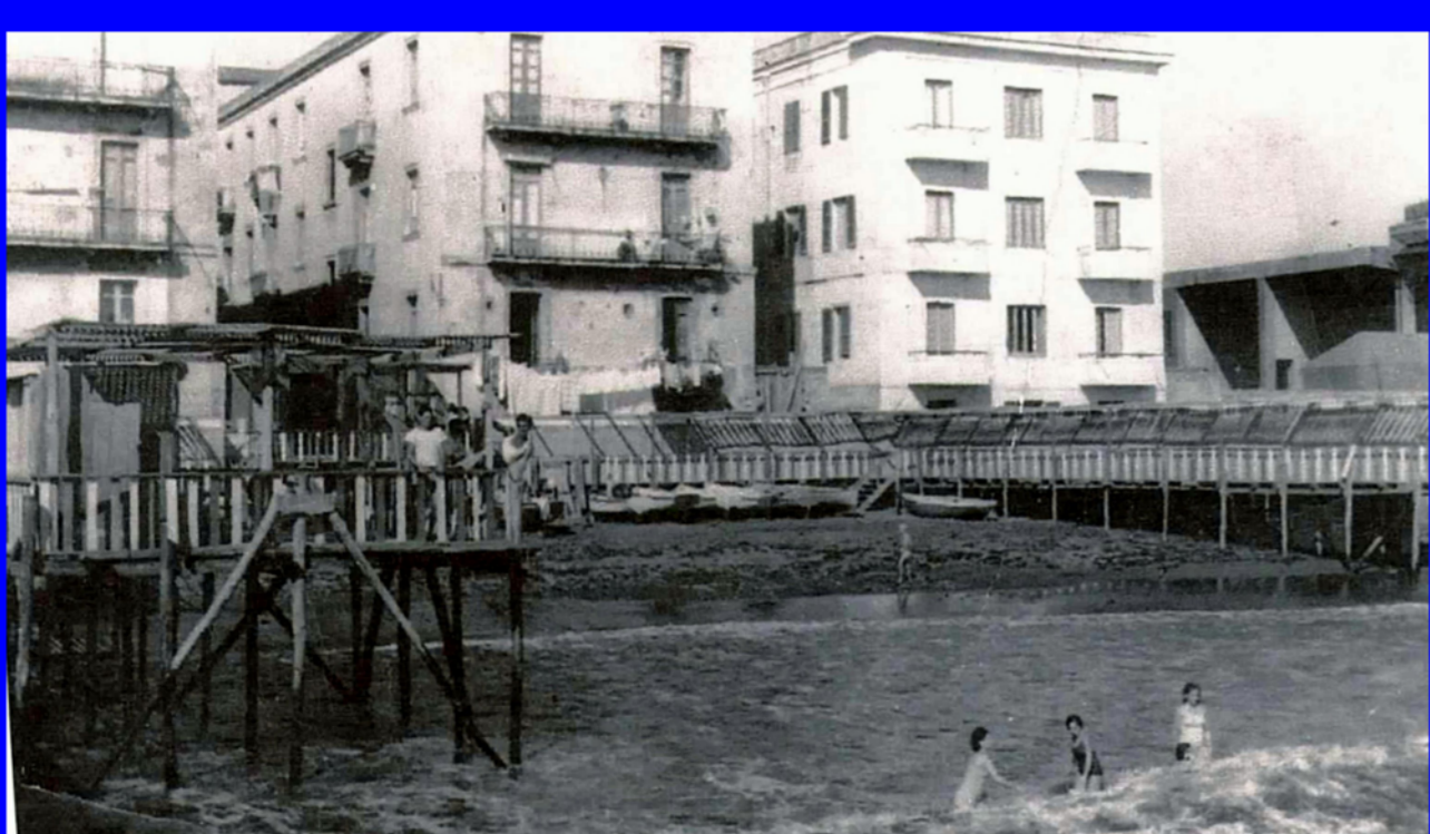
Bagnoli, Lido Nettuno - anno 1957