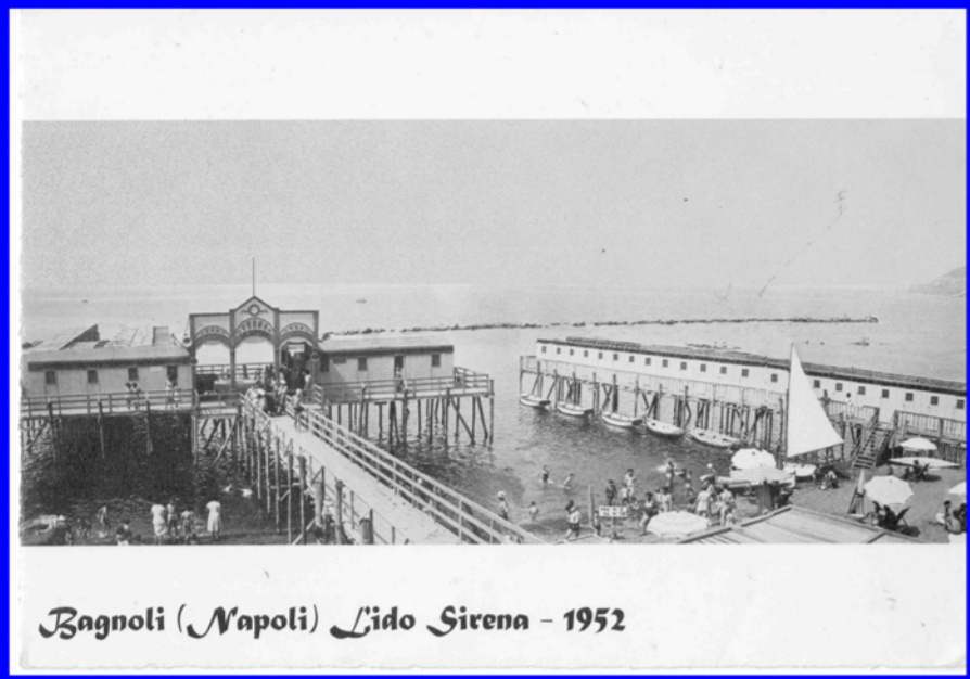
Bagnoli (Napoli) Lido Sirena - 1952