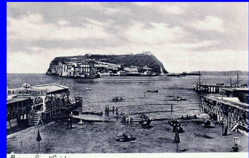
Coroglio, Bagno Azzurro - fine anni '30